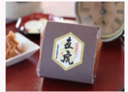
引用：糀屋本藤醸造舗HP

「直虎」からは、必ずしもドラマの主人公である「井伊直虎」を特定できない、という理由です。実際、長野県の味噌製造会社は長野県須坂藩藩主である「堀直虎」にあやかって「直虎」の商標登録を受けたもので、「直虎」は「井伊直虎」とイコールで結ばれるほど、有名な武将とはいえないと判断された、ということです。